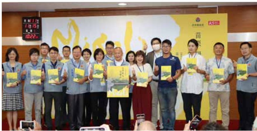
●縣長徐耀昌偕同局處主管與來賓發表「苗栗 慢哲學」專書。

徐耀昌強調，團隊 8 年紮根築底，終於讓「觀光科技大縣」的願景逐步實現，而所謂慢就是快，與縣府團隊以穩健的步伐，創造苗栗不凡的價值，歡迎大家共同見證苗栗的蛻變與成長。