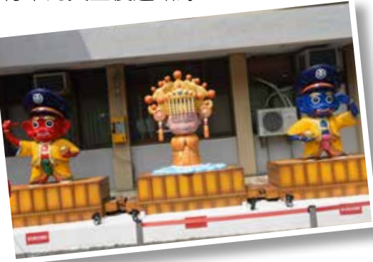
● 通霄白沙屯有全台唯一媽祖意象的火車站。

苗栗縣政府在民國 110 年向交通部爭取經費辦理「苗栗縣綠光海風自行車道優化工程」，預計民國 111 年底開工，工程建設包含改善自行車道鋪面、景觀服務設施、建構標誌標線及優化自行車路線外，另外結合自行車道沿線的自然人文秘境，建構多元自行車路線，提供不同層次旅遊，如濱海生態之旅（竹南龍鳳漁港→假日之森→親子之森→長青之森）、宗教文化巡禮之旅（後龍清海宮→山邊媽祖→白沙屯拱天宮）及日落黃金海岸之旅（白沙屯漁港→台鹽通霄觀光園區→新埔車站），串聯沿線著名景點，打造苗栗自行車的黃金慢遊路線。