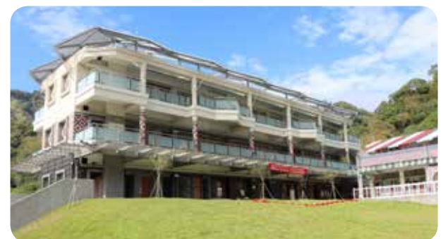
●原鄉象鼻國小新建校舍有傳承泰雅文化寓意。