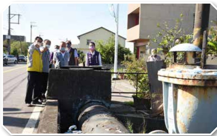
●難度最高的苑裡121線第一工區，終於即將招標打通瓶頸。

至於聯絡通霄與苑裡兩鎮的121線，早於12年前即完成拓寬工程，然部分路段因民眾與住戶存有疑義未同步施作，進而形成交通瓶頸，後經地方各界積極協調，有3處工區終於化解心結達成共識。目前3處工區已先後完成2處，縣長徐耀昌視察即將招標的第一工區時，感謝大家的努力，尤其搬遷讓地犧牲權益的所有權人和住戶，為提升道路品質與安全的付出，促成最後一哩路打通任督二脈。