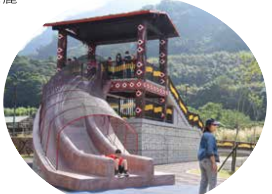
●「WAKHUL」親子公園啟用，遊憩設施的設計與圖騰都有泰雅特色。

徐耀昌表示，「WAKHUL」親子公園佔地4626平方公尺，耗資2150萬元，設施呈現族群本身文化特色，經費是各鄉鎮市特色公園之冠，顯示縣府對原鄉和部落文化及相關權益的重視。他歡迎大家多利用遊憩設施，但也要愛護裡面一草一木和設備。