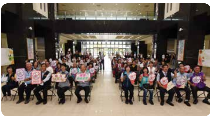
●縣長徐耀昌授證給獲優良標章業者，呼籲全民為食安把關。

縣長徐耀昌表示，縣府團隊長期配合推動各項食安政策，目的是希望能建立縣民眾對食品安全的信心，藉由評核可輔導食品業者提升製作環境與衛生安全管理等，也期許獲得授證的業者持續落實自我管理，他並呼籲鄉親一起來打造安全、衛生、健康的幸福家園。