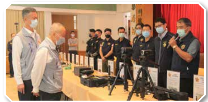
●縣長徐耀昌檢視警局新添購維護執勤安全的各項裝備。

縣長徐耀昌由局長陳武康陪同巡視會場展示的新購裝備，並以暴民衝突的模擬情境，演練各式裝備的使用時機，員警演練動作逼真精實，迅速平息劍拔弩張的緊急狀況，呈現新購裝備的實用性，確保能夠保障員警的執勤安全。新添購裝備迅速到位，正如縣長所說「執勤安全就像緊急救護一樣，不能等！」