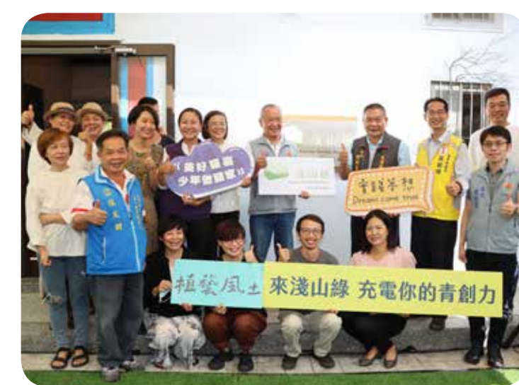
●「淺山綠青年」全縣第6個青創基地揭牌啟用。

副縣長鄧桂菊由教育處長葉芯慧等人陪同，到竹南國小關心並與學童共進營養午餐。鄧桂菊表示，石斑魚是高單價魚類，藉由「班班吃石斑」可讓孩子吃的開心又健康，也要感謝團膳廠商，使用新鮮石斑料理成為美味佳餚，讓學童午餐的幸福感倍增，希望透過吃魚、享受魚類的鮮美的同時，教導孩子愛惜海洋資源，結合縣府近年努力推動的慢魚計畫，深化校園食魚教育及海洋教育課程，實現海洋生態平衡及永續發展，一起守護美好環境。