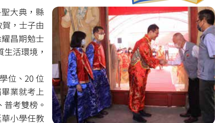
●29位士子開中門，縣長徐耀昌逐一握手致賀。

縣長徐耀昌讚許29位士子是苗栗之光，期勉大家再接再厲，不論博士或高考及第，都能善盡一份社會責任，與縣府一起打造優質生活環境，為苗栗的永續經營和繁榮打拚。徐耀昌表示，每年開中門的士子，都是苗栗優秀的子弟，不論在專業領域、作育英才或公共事務等，都能發揮影響力，讓苗栗學風更盛、人才輩出。