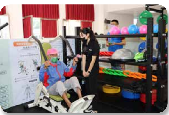
●銀髮族在專業教練指導下，正確使用俱樂部設備健身。

苗栗縣政府爭取衛福利部國民健康署前瞻基礎建設計畫特別預算，辦理「前瞻2.0銀髮健身俱樂部補助計畫」，今年度獲補助款400萬元，陸續設立4處銀髮健身俱樂部據點。西湖鄉公所與頭份市衛生所兩處俱樂部，繼竹南「惠揚關懷協會」及銅鑼「竹森社區發展協會」之後，於11月初相繼啟用，4處全數達標，未來希望其他鄉鎮市都各有1處銀髮族專屬的健身場所。