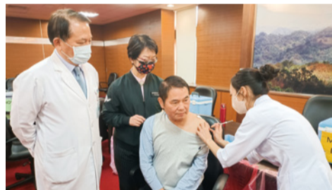
▲縣長鍾東錦挽袖施打第四劑追加劑疫苗，則起帶頭作用。

研究資料顯示，打疫苗肯定可以提升保護力，避免感染導致重症或死亡；鍾東錦呼籲鄉親響應「苗準健康、疫苗加一、解封安心」，踴躍接種疫苗，以保護自己和家人親友的健康。