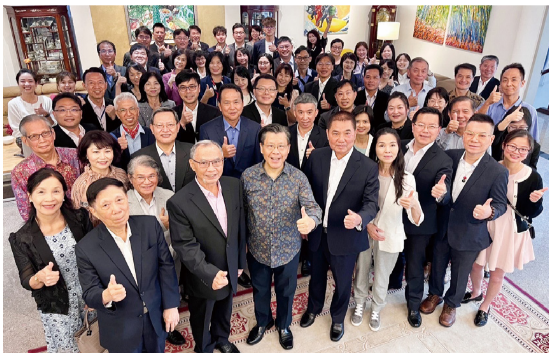
▲縣長鍾東錦率參訪團在「慢慢苗栗」國際推介會，行銷苗栗觀光資源的魅力。

苗栗縣長鍾東錦 3月中旬率同文化觀光局與教育處團隊及觀光產業代表，前往新加坡參訪，觀摩雙語教學、參訪國家圖書館及推介苗栗縣的觀光旅遊優勢，期借鏡星國成功的發展經驗，強化觀光與教育政策內涵，促進兩大領域的發展。鍾東錦表示，考察行程汲取活化雙語教學實務，以培育更多具國際視野的雙語人才；另在疫情解封後，國際旅遊市場有擴大趨勢，整合國際雙慢城及魅力景點等資源，透過推介會爭取旅行業者和國際觀光客，將苗栗觀光亮點納入遊程，把人潮、錢潮帶進苗栗，加速帶動縣內觀光休閒產業蓬勃發展。