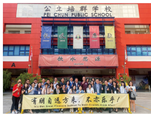
▲參訪公立培群學校觀摩雙語教學。

教育團隊先參訪新加坡的公立培群學校和教育部。「培群」在雙語教育實踐經驗和教學策略都相當多元豐富，從語言環境的創建到多元教學策略的應用，乃至於學生自主學習的培養等，都相當具體且用心，是一所成功的特選學校，尤其對學生雙語能力的展現，以及對多元文化的尊重和包容，都留下深刻印象。