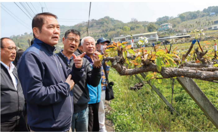
▲苗栗縣高接梨穗因寒害受損嚴重，業經農委會核定現金救助。

苗栗縣高接梨嫁接梨穗寒害嚴重，初查梨穗損害率平均 2 至 5 成，已達天然災害救助標準，縣長鍾東錦關心農民權益，會同農糧署、農改場及農會相關人員至卓蘭勘查災情後，指示縣府農業處加速彙整資料，報請農委會辦理天然災害現金救助，以減輕農民損失。農務科表示，中央已核定梨穗天然災害救助，每公頃可獲現金救助 6 萬 2000 元；農委會另開辦梨產品保險，在極端氣候下，鼓勵梨農可多利用以分散風險。