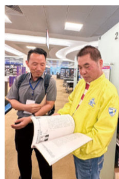
▲實際走讀新加坡國家圖書館，赫然發現 20 多年前出版的鍾姓宗親會的會刊，竟收藏在館內。