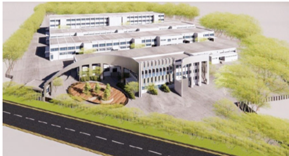
▲太空科學園區對苗栗發展為太空科技重鎮，具指標性意義。

力晶積成未來 3 年亦將加碼投資 600 億元，導入智慧化產線，結合 AI、大數據、物聯網等創新技術，累計投資金額將達 3380 億，並引進節能減碳技術，規畫提高綠電使用比率及能源、資源回收系統等。