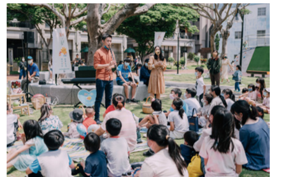
▲與在地青年一起在公園辦市集，趣學生活團隊演出。

心得，但他也不諱言創業非常辛苦。他認為創業不應該是唯一選項，不是每個人都要走這條路，就業、繼業都是很好的選擇，我們要給予在地用心生活的每一個人掌聲，我們可以在自己能力裡把自己的生活穩固，進一步想看看可以跟幾個朋友一起做些事情，有更多能力時組成社團推出行動，一點一滴的方式更能讓在地方生活更有信心和能力。