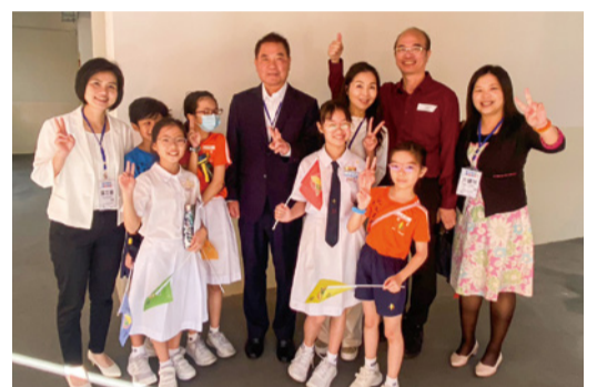
▲學生開心與縣長及來賓合影。

帶領苗栗縣旅館公會、觀光協會、泰安溫泉觀光協會及多家業者跨海推廣觀光，介紹縣內自然親和、友善舒適的觀光旅遊資源，希望透過當地的旅行社、各航空公司和媒體等多元管道，讓苗栗縣的好山、好水和好人情躍向國際，從慢城、慢魚、步道、溫泉到農村，還有近年來大受青睞的舊山線鐵道自行車等，都是世界旅遊的魅力焦點。