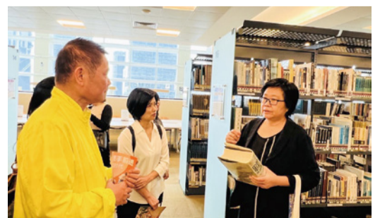
▲分享融合傳統與科技的圖書館，期藉閱讀打開世界之窗。

縣長鍾東錦表示，苗栗慢城特色資源適合民眾深度體驗，越來越多新加坡遊客對苗栗景點感到高度的興趣，加上語言相近、交通往來便利，吸引新加坡民眾將苗栗列入必遊行程。鍾東錦進一步說明，苗栗有四季分明的天候和自然景觀，有多元族群和文化，特色節慶活動及遠近馳名的客家美食，歡迎新加坡旅行同業後續能安排到苗栗採線考察，感受漫遊苗栗魅力，體驗慢食、慢遊、慢活的旅程，並分享給更多的新加坡好友，增進兩國情誼的同時，也帶動苗栗觀光休閒、活絡產業商機。