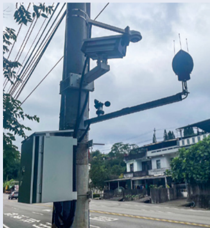
▲台 3 線固定式噪音照相設備。