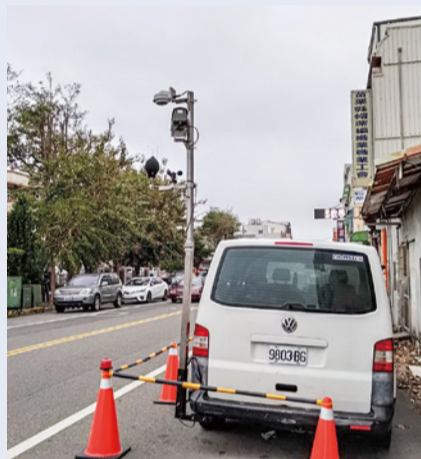
▲車載式噪音照相系統。

為更有效管制噪音汙染，環保局在台 3 線建置固定式聲音照相設備，全天候取締噪音車輛，都會區不便設置攔檢點的區段，則引進車載式聲音照相系統，不需耗費人力且可不分晝夜執法，以維護民眾生活環境安寧。