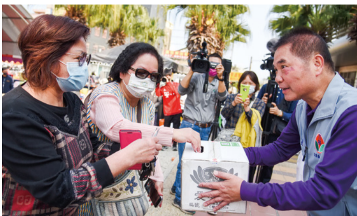
▲響應馳援土耳其慈善活動，縣長鍾東錦捐款並協助募集愛心。

基金會結合熱心志工逾 500 人，在竹南火車站募集善款，縣長鍾東錦與來賓出席莊嚴的祈福禱儀儀式，祈求土耳其、敘利亞兩國的災情不再擴大，災民早日度過難關。鍾東錦不僅慷慨解囊，捐款及選購義賣品，還擔任志工協助募款，以行動支持這場國際性的公益活動。