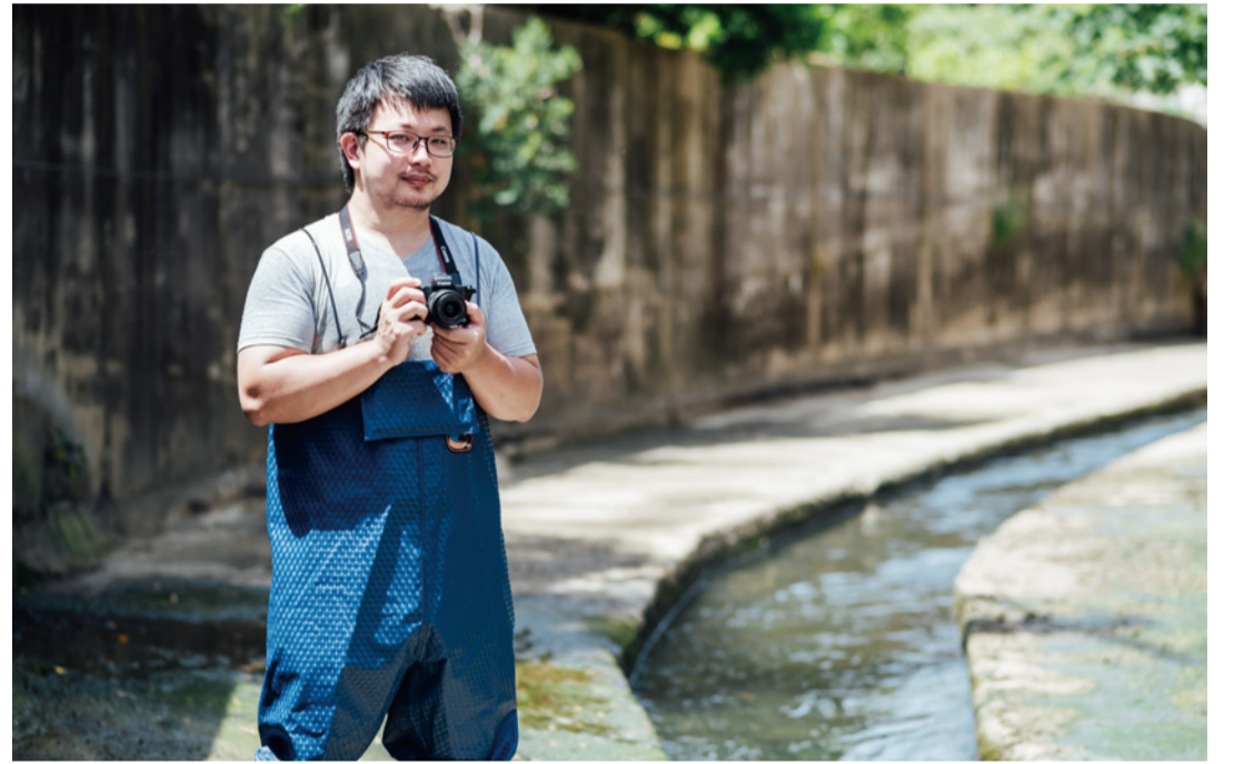
▲以水圳計畫獲得教育部金獎肯定。

建成接著分享，回想共發開業之後，許多客人會詢問周邊推薦景點，那時候共發沒有預算，也不知道怎麼畫地圖，乾脆就畫得「超不精準」，如同每次在紙條上畫的那樣。以非常生活感的方式畫出，沒有一條路、一個座標是正確的，但是推薦的景點都有很強的在地特色，因此獲得非