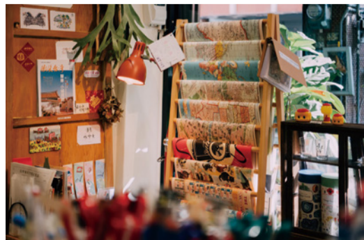
▲共發店內有許多特色文具，都是主理人精選。

進，就先在家裡的雜貨舖裡放一個小書櫃，推出了飄書活動，沒想到得到許多迴響，那個小書櫃就叫做「共發」，這個名字是客語「說話」的諧音字，寓意著希望可以透過對話，讓物品買賣之外有更多文化交流。