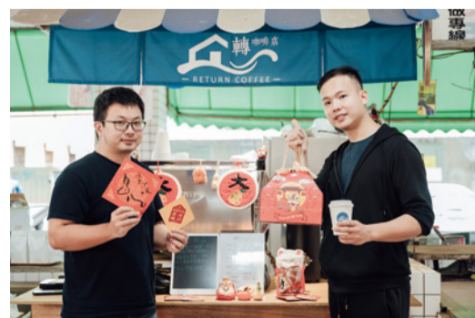
▲過年到北苗市場寫春聯，客語春聯超趣味。