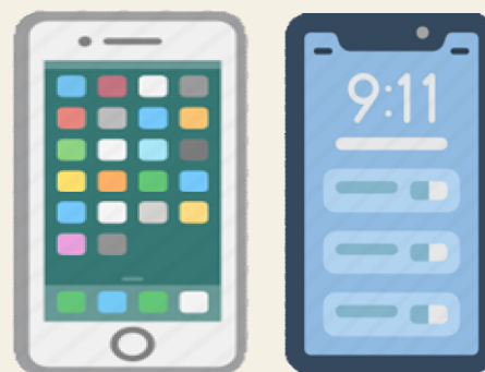
智慧型手機或平板電腦