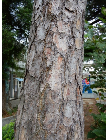
照片 4：幹皮粗糙縱向溝裂