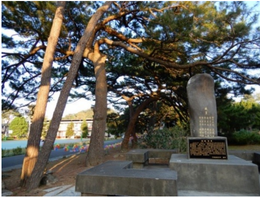
照片 5：建校捐款芳名紀念碑位於松樹旁