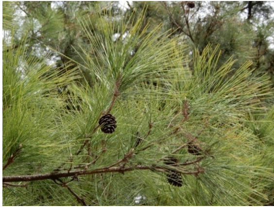
照片 7：琉球松枝葉及毬果