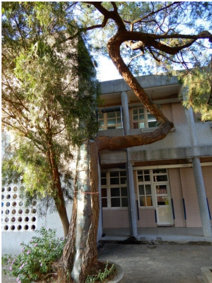
照片 3：10 號松樹生病，請樹木醫生救治