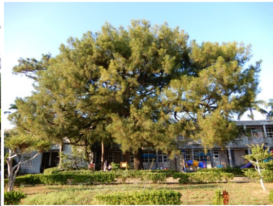
照片 3：樹冠型最美的 9 號琉球松