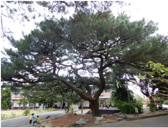
照片 2：最大株的 1 號琉球松