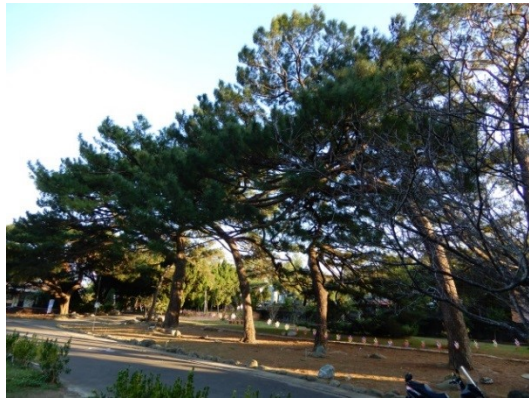
照片 6：成排之琉球松