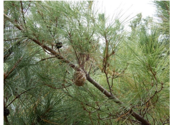
照片 8：常見鳥巢與松鼠之巢