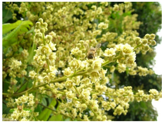
照片 6：頂生的圓錐花序