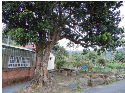
照片 1：樹與廟是不可分割的信仰共同體