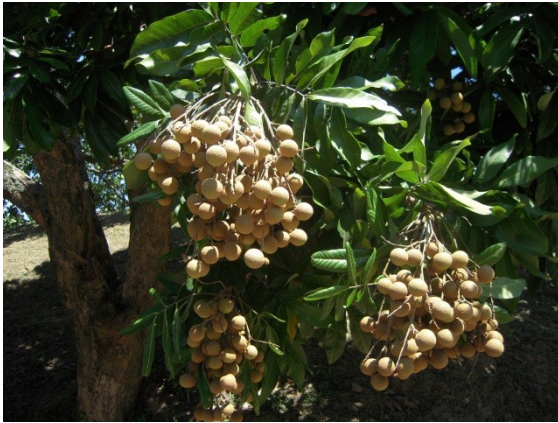
照片 5：串串果實掛於枝頂