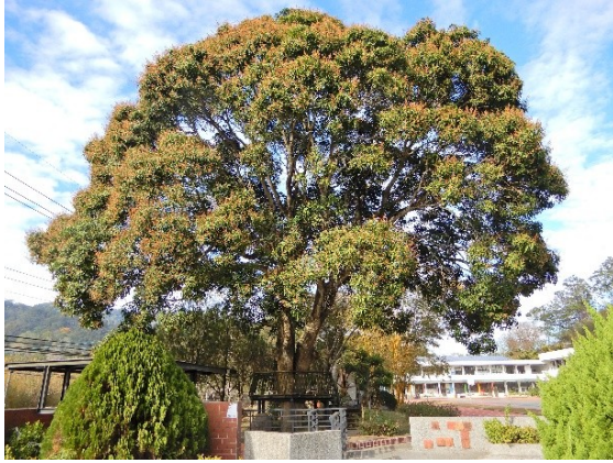
照片 1：樹型優美健壯位於校門口

惟設置於樹周邊鐵架圍欄有少數變形，因樹幹不斷長粗，護欄與樹幹周圍空間愈來愈窄，已經無法於樹周圍通過，且平台上的木板已經接觸樹幹，已擠壓到樹幹的生長，應立即將接近樹體的木板拆除，或重新評估該平台的處理方式，以不妨礙樹木健康生長為優先考量。