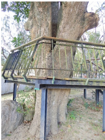
照片 3：護欄與樹幹周圍空間愈來愈窄