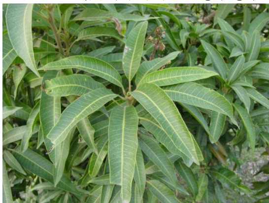
照片 5：芒果樹枝葉多近叢生於枝條先端