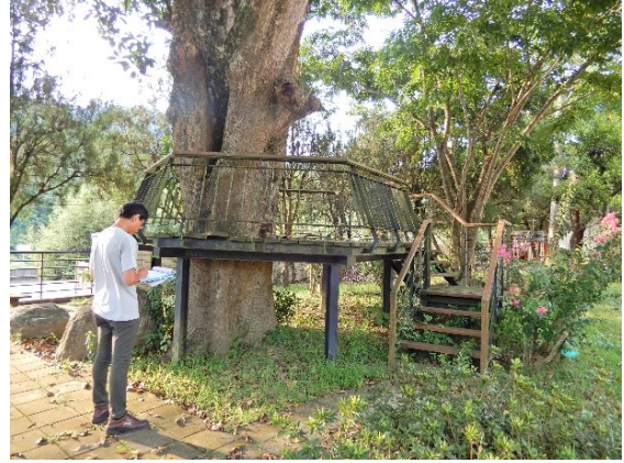
照片 2：設置鐵架並鋪設木棧道平台