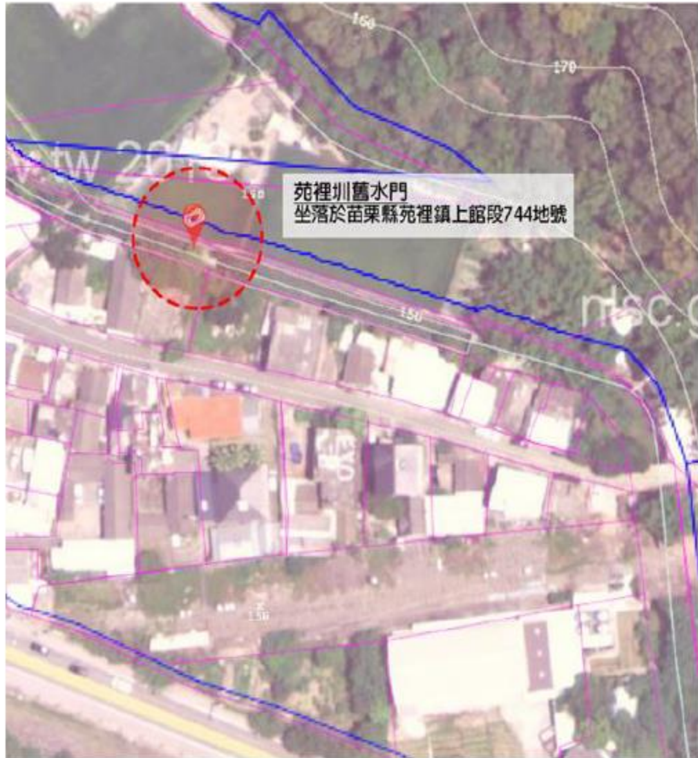
圖片一苑裡圳舊水門（航照圖套繪地籍圖）。