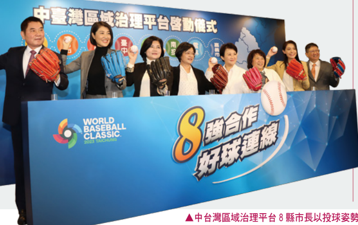
▲中台灣區域治理平台 8 縣市長以投球姿勢，象徵 8 強合作、好球連線。

新年度的中台灣區域聯合治理平台續有新竹市加入，增至 8 縣市並擴大合作範疇。2 月 16 日在台中市政府惠中樓舉行啟動儀式，8 縣市首長親自出席，宣告中台灣區域治理平台邁入新紀元；他們以投球姿勢齊喊「8 強合作·好球連線」口號，啟動國內規模最大的治理平台，苗栗縣長鍾東錦期許透過縣市合作，成為最佳夥伴，打造更具魅力的中台灣。