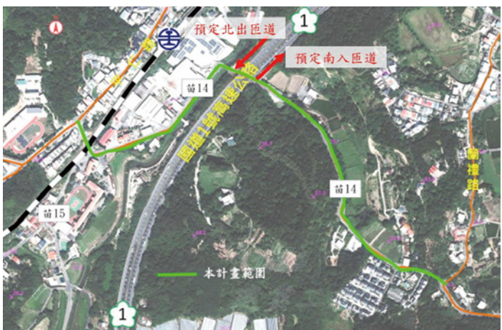
▲交通部核定補助苗 14 線、造橋交流道聯絡道拓寬路線圖。

國道中山高速公路增闢造橋交流道一案，交通部已針對苗 14 線即造橋交流道聯絡道拓寬工程，核定總經費 2.7