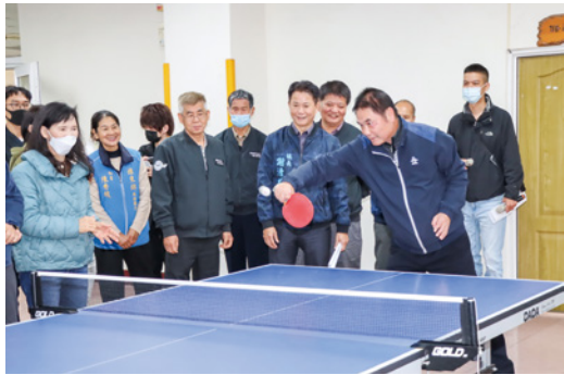
▲縣長鍾東錦視察老人福利服務中心時以球會友，下場一展不俗球技。

縣長鍾東錦會同議長李文斌、鎮長謝清輝等人視察健身設施，受邀演唱並下場以球會友。鍾東錦聽取地方意見後，允諾馬上改善桌球室地板太滑的缺失，以維護長輩的運動安全，另增設 1 間球室、補助 2 張球桌，縮短長輩等待時間。