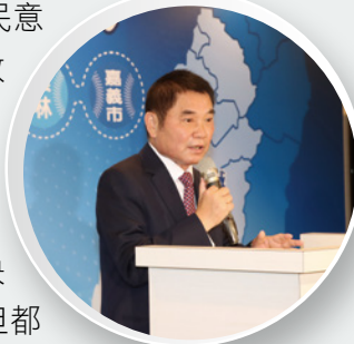
▲縣長鍾東錦強調苗栗將配合平台運作成為最佳夥伴。

苗栗縣長鍾東錦感謝盧秀燕繼續擔起中台灣 8 縣市領頭羊的重任，在既有的合作基礎下，擴大縣市合作，相信未來平台合作議題更豐富多元，政策推動會更加貼近民意。鍾東錦說，他是城市治理的新人，要請益學習的地方很多，希望大家不吝分享寶貴意見及城市治理的經驗，苗栗也會全力配合平台運作，大家攜手合作，打造更亮眼、更具魅力的中台灣。