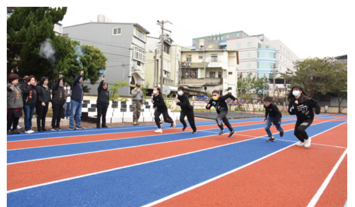
▲全縣已有 30 所學校操場及周邊設施完成整建，學生在新跑道盡情奔馳。

教育處指出，112 年有 12 校將繼續執行整建運動操場及周邊設施工程，會落實督導責任於年底前如期如質完工。另配合中央政策，縣內已有 26 校相繼設置風雨球場和光電球場，目前尚有 11 所正在執行中。