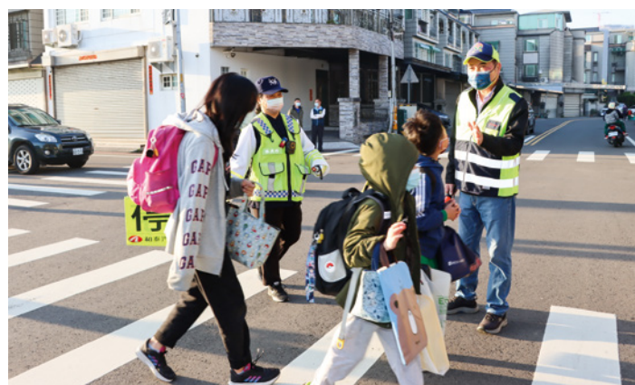
▲縣長鍾東錦於開學日，擔任導護志工維護學子上學安全。

安全闖關遊戲和機智搶答，寓教於樂。他說，目前全縣約有 320 位導護志工，執勤保險由縣府全額負擔投保，並定期辦理基礎及特殊訓練，以落實維護學生上下學安全。