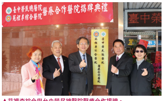
▲苑裡李綜合與台中榮民總醫院醫療合作揭牌。

長期提供苗栗縣海線地區急救與醫療照護的苑裡李綜合醫院，今年開始與台中榮總合作，將引進醫學中心資源，增加鄉親醫療的可近性與便利性，這是繼為恭醫院與中國醫藥大學之後，第二組策略聯盟醫院。事實上，縣長鍾東錦走馬上任之初，即深切了解民意對醫療資源與品質的殷切期待，迅速責成衛生局今年度在兼重策略與政策雙重面向之下，訂定擴大醫療量能和優化就醫品質的具體作為，以守護鄉親健康並保障就醫權益，戮力達成「醫療照護、精實俱進」目標。 縣內醫療院所與醫學中心合作的首例，是頭份為恭醫院於 111 年 6 月底與中國醫藥大學，在前縣長徐耀昌等人見證下，簽署策略聯盟合作，強化 16 項專科照護，並陸續引進 40 多位優秀專科醫師，厚實苗北地區的醫療量能。第二例續由新任縣長鍾東錦接手推動，今年元月 16 日偕台中榮總院長陳