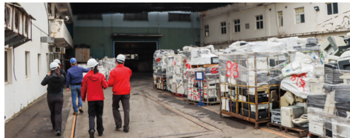
▲縣長鍾東錦指示加強聯合稽查資源回收業，勒令限期改善缺失並將違規業者送辦。

今年元月中旬正是農曆春節前幾天，接連傳出多起與資源回收業有關的火警，不僅衍生空氣汙染或殃及左鄰右舍，甚至釀成 1 名老翁葬身火窟；部分火警疑涉「人為」因素，引起縣長鍾東錦高度關切，指示環保、工商、消防及警察等單位，針對 26 家列管業者展開第一波聯合稽查行動。稽查結果，6 家有違規和缺失，均要求限期改善；另 7 件相關火警中，4 件已移送裁罰及法辦。