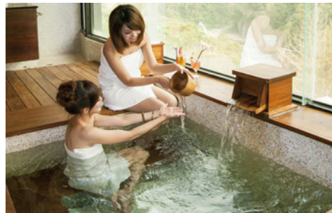
▲泰安溫泉被譽為美人湯，屢獲國際金泉獎殊榮且廣受遊客青睞。

交通部觀光局主辦的「2022-2023 台灣好湯」金泉獎票選活動，苗栗縣的泰安溫泉獲 7 萬 156 票數支持，為台灣 19 大溫泉區域第一名，縣府感謝鄉親及全國遊客的大力相挺。而泰安溫泉區經專家評選後，囊括「十泉十美獎」銅獎及「最佳 CP 值獎」金獎，未來將加辦行銷活動提供遊客更多優惠，歡迎全國民眾到泰安泡溫泉、賞美景、品美食，體驗美人湯的獨特魅力。