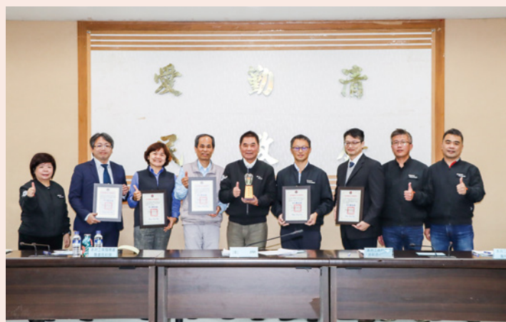
▲縣長鍾東錦心繫工商發展，在工業聯繫會報中表揚績優企業，另與商業會交流座談。

縣長鍾東錦推薦，泰安除有優質的溫泉和設施外，還有得天獨厚的自然環境、泰雅原鄉文化、特色伴手禮和在地美食等，泰雅文物館和親子公園相關設施亦是亮點，是遠離城市喧囂，體驗獨特「旅湯文化」的最佳選擇。