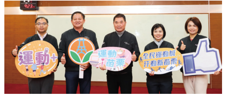
▲頭份與苑裡將分別增設全民運動館，鼓勵「汗」動健康新苗栗。

民運動館則新建於中正社區活動中心旁，有助掀起運動風氣，滿足多元運動的需求，興建期約需 2 年半。