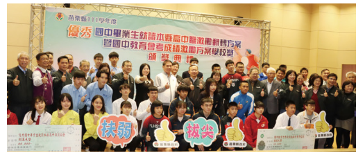
▲縣長鍾東錦頒發國中會考績優並留鄉就讀的畢業生獎勵金。

縣長鍾東錦說，學習力即競爭力！他上任後非常重視優秀人才的培育，將更用心推動教育獎勵政策，此次的激勵方案就值得加強推廣，有助鼓勵更多優秀學子留下來，不再舟車勞頓遠赴外縣市就讀，期待激勵方案繼續提升教育水平，再創造教育新高峰。