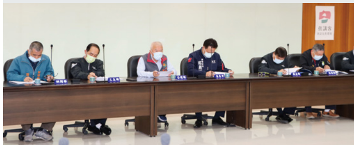
▲苗栗縣政府縣務會議邀請 18 鄉鎮市長分區列席，雙向溝通以提高行政效率。

苗栗縣長鍾東錦裁示自元月份起的縣務會議，開始分區邀請鄉鎮市長列席，俾利針對地方重要建設與發展，直接與業務主管單位溝通並雙向交流意見。至目前為止，18 位鄉鎮市長已分 3 梯次各出席 1 次縣務會議，分別討論地方軟硬體建設及民生議題，部分會中逕由縣長裁示或交辦執行，有助縮減公文往返流程，大幅提高行政效率。