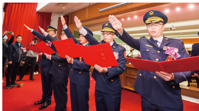
▲警察局近期高階警官大調整，圖為 5 位新到任分局長宣誓就職。

苗栗縣警察局 2 月 9 日舉行卸、新任分局長聯合交接典禮，由縣長鍾東錦主持、局長莊勝雄監交，各級民意代表及地方各界踴躍觀禮，場面簡單隆重。這是繼局長莊勝雄元月到任後，1 個月內續有副局長、督察長、主任秘書及 5 位分局長等重要警職調整，調動幅度歷來最大；鍾東錦勉勵新到任幹部展現熱忱、發揮專業，打造宜居幸福家園，不負鄉親所託。