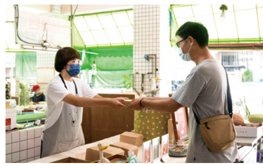
▲期待將品牌精神傳遞給每一位客人。

考量現代人多為小家庭，小份量的包裝不僅友善食物、友善獨身者，也讓客人輕鬆還原一盤道地的客家料理。烹煮、放涼、打包、冷凍、配送，每一個環節世棻和媽媽兩人親力親為，並透過哥哥的設計巧思，跳脫傳統思維，重新定義了客家伴手禮的形象。從內至外、從食物至包裝，期待將品牌精神傳遞給每一位客人。