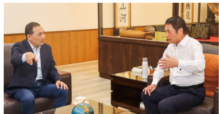
▲新北市長侯友宜率市府團隊到訪，與縣長鍾東錦交流意見。

縣長鍾東錦指出，苗栗縣農產品種類很多，尤其有機農業的面積不斷增加，盼能與新北市合作行銷至各地；新北客家人口也很多，未來可密切合作、交流，加強傳承、發揚客家文化的力道。