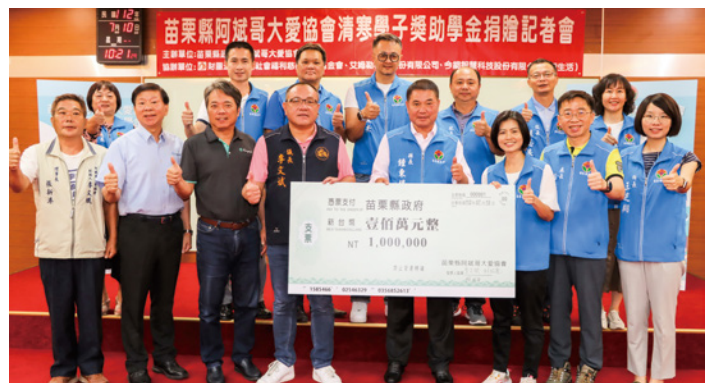
▲阿斌哥大愛協會攜手企業和慈善團體，連 8 年每年捐贈 100 萬元幫助清寒學生。

苗栗縣阿斌哥大愛協會結合艾姆勒科技、今網智慧科技公司及彩雲社會福利慈善事業基金會，連續第 8 年捐贈縣府每年 100 萬元助學金，幫助弱勢學生奮發向上。縣長鍾東錦頒狀感謝協會攜手企業的善行義舉，期藉此拋磚