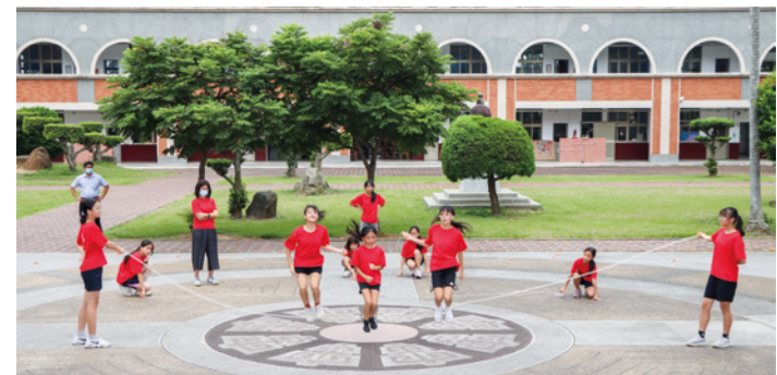
▲縣府推動高鈣午餐搭配跳繩運動，讓學童身高體態迎頭趕上。

苗栗縣政府 112 學年度起將強力推動「高鈣午餐及跳繩競賽」實施計畫，希望幫助學童在學習階段，透過健康及體育相關課程，教導孩子均衡飲食的觀念，預先儲存足夠的骨本。縣長鍾東錦近日到銅鑼國小，關心學童的營養、運動和生活作息，鼓勵學童均衡營養搭配跳繩運動，奠定生長發育的良好基礎，有效改善身高與體位。