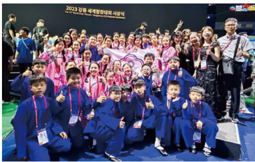
▲建國國小合唱團赴韓參加世界合唱比賽，榮獲金質及銀質獎兩項殊榮。

此次由 8 位師長帶領 34 名學生遠征韓國江陵，參加由德國 Interkultur 財團每 2 年舉辦 1 次，最具規模的 World Choir Games 世界合唱比賽，儘管練習場地與次數受限，既要適應陌生環境，又得排除忽雨忽熱的不利因素，但他們仍在 14 隊強敵環伺下，以堅強實力和美聲，囊括 1 金 1 銀佳績，呈現深耕才藝教育的亮麗成果。