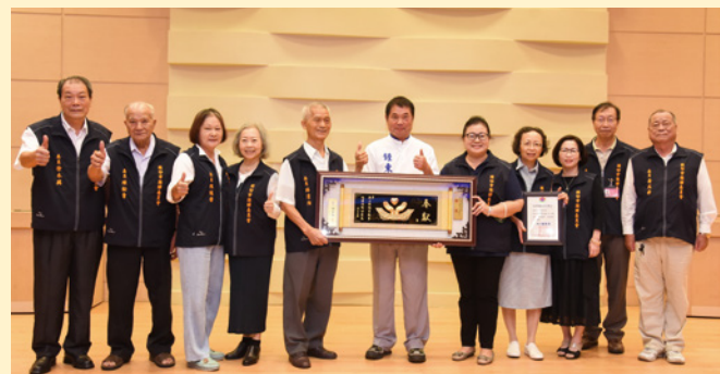
▲縣長鍾東錦接見表揚績優調解委員會及委員。

苗栗縣政府辦理 112 年度鄉鎮市調解業務講習，持續提升委員專業素養並強化調解功能；111 年全縣受理 1926 件調解案，調解成立有 1231 件，等同成功減少約 64% 的訴訟案，有效發揮減訟功能，也彰顯以民為尊及為民服務的理念。縣長鍾東錦出席研討會，頒獎表揚 90 位績優調解行政人員，感謝他們在調解業務的奉獻與努力，以熱忱回饋鄉里。