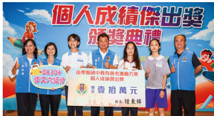
▲國中教育會考成績揭曉，縣長鍾東錦頒給3名榜首各10萬元獎勵金。

苗栗縣 112 年國中教育會考成績大放異彩，5A 人數創歷年來新高紀錄，較去年大幅躍升 20%。縣長鍾東錦於成績單寄達統計後，在縣府第二辦公大樓國際會議廳頒獎表揚 148 名優秀學生，合計頒發 137 萬餘元的獎勵金，期勉學生再接再厲繼續在另一個學習階段往前衝刺外，也要心存感恩，莫忘父母和師長的教導及鞭策。