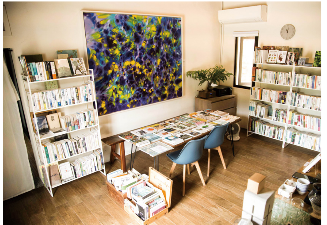
▲書店的每一本藏書，都可以感受到書店主人想透過書籍帶給人們的啟發。

「我在開書店的時候就打消隱居的念頭了，因為陽明山的生活，讓我嘗到隱居的甜頭，但是當我來到苑裡淺山，感受到