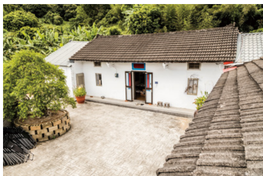
▲花草交織的淺山，每一隅皆宜心宜人……

原本她想尋找更隱蔽的山居空間，也許是緣份到了，透過苑裡友人引薦，她落腳在苑裡火炎山腳下吳姓家族的老舊三合