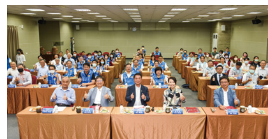
▲竹竹苗縣市政府、科管局團隊及企業代表，齊聚一堂集思廣益。

首場「園縣市共好高峰會」圓滿結束，與會單位讚許主辦方在會場佈置和議程安排都相當成功；下場高峰會預定9月由新竹縣政府主辦，緊接著輪再由新竹市政府及科管局接棒，公會則協助各次會議召集的幕僚作業。