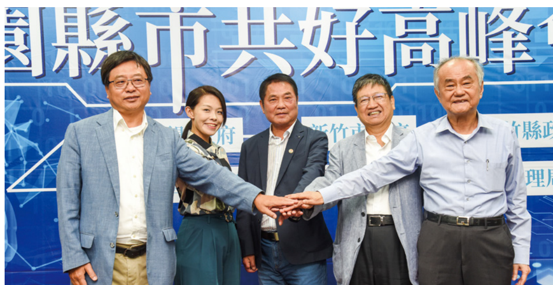
▲「園縣市共好高峰會」在三義舉行，3位縣市首長與局長、理事長攜手共創優質生活圈。

高峰會先就上次籌備會列管的6項提案，提報目前執行進度，其中5案已達成預定目標不再列管，僅竹縣有關關駛竹北國道1以東至竹科巡迴巴士提案，尚須評估運量並協調竹市公車合作，繼續列管。