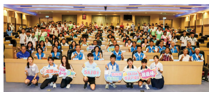
▲苗栗縣今年教育會考成績大躍進，有 148 名優秀學子接受表揚。

縣長鍾東錦表示，今年苗菓子弟有 3 人榮登榜首，非常不容易，他稱讚受獎者均已奠定良好基礎且贏在起跑點，但仍需努力衝刺，且要保有感恩的心，不要忘記父母和師長的諄諄教誨和鞭策，繼續維持良好的學習習慣，發揮影響力，成為學弟妹的榜樣。