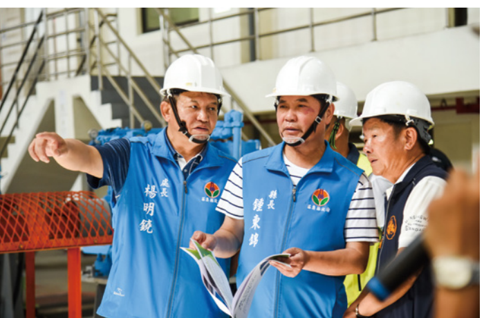
▲萬全的防汛整備方能無災無難，縣長鍾東錦視察永貞抽水站運作功能。

鍾東錦提醒鄉親，千萬不能因為颱風多年未侵襲苗栗而鬆懈警覺性，防汛期間務必提前做好防災準備，才能確保生命財產安全，平安渡過汛期。