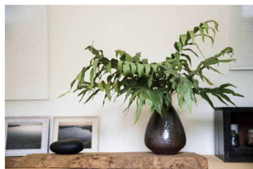
▲山居生活逍遙自在，讓她徹底理解植物和大自然對人的作用。

老屋迎賓的大廳作為主要書區，擺放著與植物、自然、身心靈、山岳文學、生命體驗的新書；穿過窄門後映入眼簾的大和室，放上幾本適合孩子們的童書繪本，讓親子共讀也能有舒適的環境；另一邊比較隱密的書架，則陳列著國外藝術相關的書籍、書友推薦的文學書。