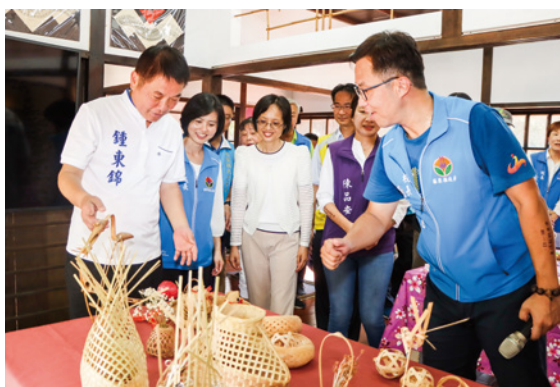
▲第 1 所樂齡學習示範中心揭牌後，縣長鍾東錦與副司長顏寶月參觀學員創作。

縣長鍾東錦表示，苗栗縣人口老化，要如何讓長者受到尊重並享受生活樂趣，是個重要課題，樂齡學習正好可以讓長輩在日常生活中感到快樂，也讓在外工作的子女能夠安心打拚；「真正的快樂會讓身體健康」，鍾東錦鼓勵長輩常到環境優質的樂齡示範中心上課學習，增進健康、延緩老化。