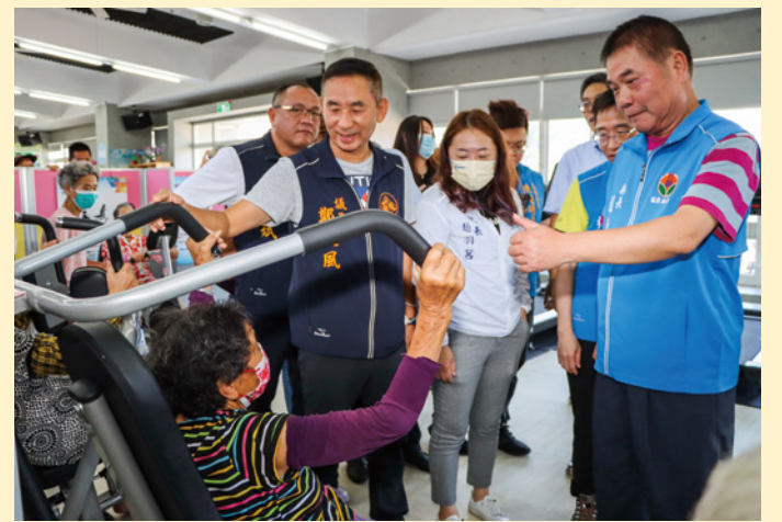
▲縣長鍾東錦鼓勵長輩多利用健身器材，增進健康、延緩老化。

另鑑於西湖鄉老年人口比率達 26.36%，僅次於獅潭的 28.71%，全縣排名第 2，縣府為提供老年人優質生活環境，副縣長鄧桂菊於 7 月初，為三湖村醫事 C 巷弄長照站揭牌，成為全鄉第 4 處長照站，同步提供健康促進、延緩失能和共餐等服務，讓長輩「老有所適」、家人也放心。