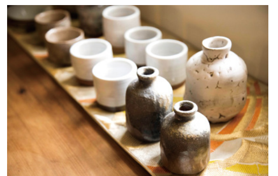
▲陶藝家的手做陶，為淺山綠增添在地溫度。

她說，「淺山」是一個地域的名稱，相較於大家聞名的陽明山，或登山熱門的高山，它是屬於在地人的家山，一座出門