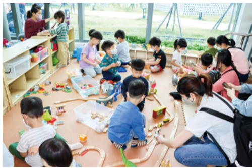
▲頭份親子館今年 3 月開幕

可再增加 195 個收托名額。另目前設有北區、中區及頭份親子館共 3 處托育資源中心，其中頭份親子館特別打