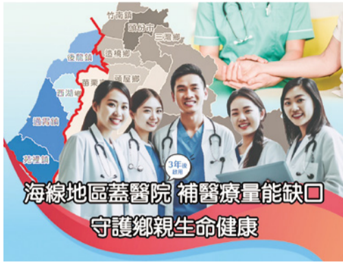
▲醫審會通過白沙屯童醫院籌設許可

353 場，發現 387 人癌前病變、確診癌症人數 68 人，已進行追蹤轉介管理。推動 C 肝微根除計畫，在高風險鄉鎮辦理大規模肝炎免費篩檢，根據中央統計，本縣 C 型肝炎抗體篩檢率達 71.8%，為全國第一，治療率高達 95.5%。