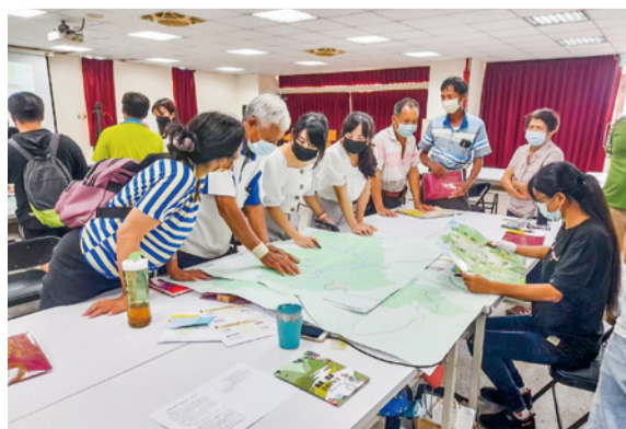
▲鄉村地區整體規劃案主題式工作坊

另本府由「招商服務馬上辦中心」、「全栗招商服務站」及「A+招商服務團」組成招商鐵三角，也與苗栗縣工商投資策進會攜手合作，加速招商服務優化。在招商策略多箭齊發的努力下，統計111年12月底至目前，本縣累計投資金額已達2,149億元。未來我們將持續奮力招商，期能為鄉親帶來更多工作機會、為苗栗創造更充沛的稅賦收入。