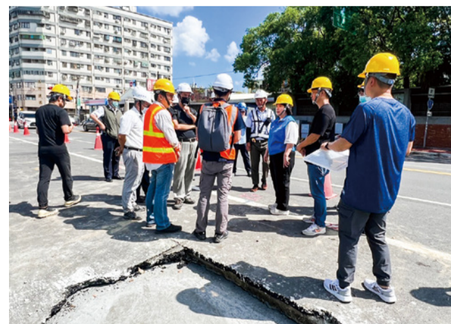
▲會同專業技師現場勘查並要求立即改善沉陷情況

本府堅持以最高標準審視施工安全，透過新訂法令規定嚴格規範審查及管理機制，都是為了確保施工過程中的每個環節都符合安全標準，防範天坑事件發生，以充分保障民眾生命財產安全。