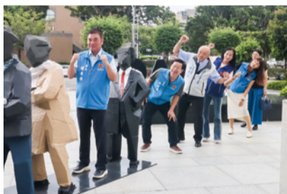
▲苗北藝文中心-朱銘雕塑特展

此外，今年的「苗栗縣藝術種苗播撒計畫」，邀請到大小朋友都喜愛的紙風車劇團蒞縣演出了 5 場次，場場爆滿；「2024 苗北藝術節」更由重量級的《彩繪人間—朱銘雕塑特展》拉開序幕。其餘如「第 7 屆貓裏表演藝術節」、「第 4 屆苗栗店仔藝穗節」、「三義木雕藝術節」及「苗栗陶藝藝術節」等活動，也都每年持續辦理中。