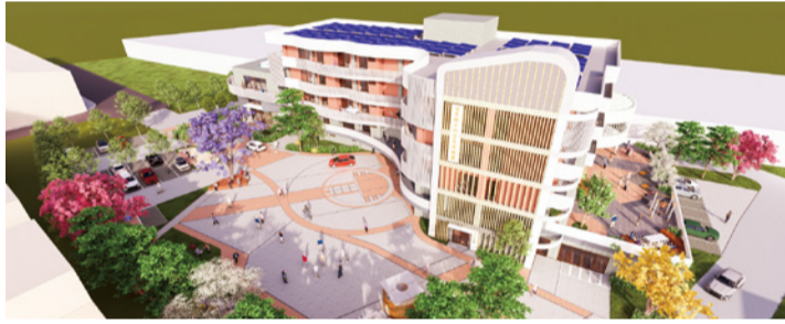
▲苗栗縣立綜合長照機構示意圖

為強化本縣長照量能、讓長輩在地安老，本府將投入 4 億餘元在銅鑼打造「苗栗縣立綜合長照機構」，強調家的溫馨氛圍、尊嚴與個人化照顧，提供社區型日照 60 人及住宿型 120 床之服務，並預計聘僱照顧服務員及護理、社工等專業照顧人力，創造約 68 個就業機會。此外，本縣長照暨衛生教育大樓 7 月正式啟用，整合衛生與社政資源，為鄉親提供更便捷效率的長照服務。