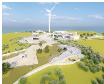
▲好望角海丘之心示意模擬圖

本府為整合後龍好望角風景區觀光遊憩資源，於今年 5 月獲交通部觀光署核定「白沙聖域·天空之丘·白沙屯至好望角濱海重要廊帶整體規劃計畫」，總經費 4 億 500 萬元，將以白沙屯拱天宮媽祖文化與好望角遊憩區為核心，規劃「好望角海丘之心」、「百年過港隧道時光秘境」、「海角新樂園海音廊帶」、「山邊媽祖及舊南港濱海活動區」及「拱天宮媽祖及白沙屯觀光海街區」五大主題區，在海線打造一條精彩的觀光廊道。