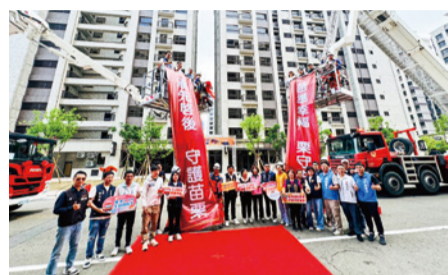
▲ 50 公尺雲梯車啟鑰典禮

本府持續充實各項救災硬體及訓練，今年斥資 4,000 萬元購置 1 台 50 公尺新式雲梯車，以提升高空救災效率；也投入 3,000 萬元採購 500 套消防衣帽鞋供義消人員使用。此外，積極推派優秀救護人員參加內政部消防署高級救護技術員訓練，也自 7 月起，在預立醫療流程下開放高級救護技術員使用骨針技術，提高傷病患到院前急救成功率。