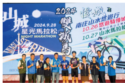
▲舉辦 2024 雙城馬拉松活動

每年辦理各項運動賽事達 190 場次，今年更有高達 9 萬 742 人參與；另為保障學生運動安全及品質，本府近年來積極向體育署申請修繕 47 校操場跑道，今年也辦理 20 校運動設施整修。另盤點縣內各運動場館整備進度，苗栗市全民運動館、竹南鎮全民運動館及公館鄉兒三公園籃球場均在施工中；苑裡鎮全民運動館正在進行相關招標作業；頭份市忠孝籃球場已竣工。另為善用空間打造更符合鄉親