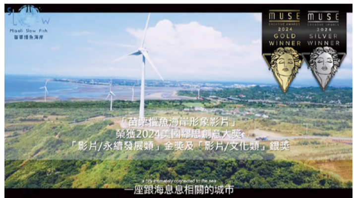
▲榮獲 2024 美國繆思創意大獎「影片/永續發展類」金獎及「影片/文化類」銀獎