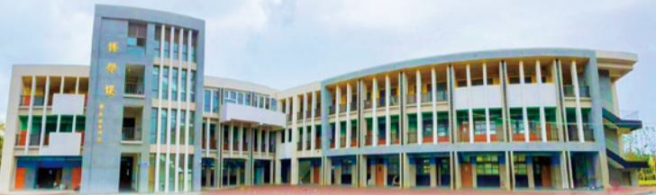
▲頭份國中自建專科大樓博學樓竣工

另為因應大矜谷推動方案核定後隨之增加的就學需求，本府除推動設立竹南科學園區實驗中學外，更積極規劃苗栗縣頭份文中三預定地新設國小、苗栗縣照南國中中文七分校新建教學大樓及苗栗縣頭份國中自建教室；另外，今年也獲中央核定 8,858 萬元，規劃於頭份建國國中分校(頭份文中三用地)新建 6 班非營利幼兒園，完成後將可提供 152 個幼生名額，希望能紓解人口移入熱區就學需求。