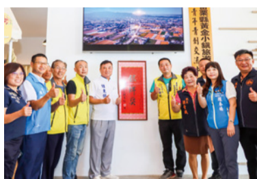
▲ 黃金小鎮休閒農業區獲得「金牌農村」銀牌獎

本次獲得金牌獎的西坪休閒農業區，成功引動大量青年及返鄉二代進駐，帶領當地農民進行友善農耕轉型、推廣秋耕無蠅計畫，也吸引了藝術家定居並與當地居民共創農村體感藝術；而獲得銀牌獎的公館鄉黃金小鎮休閒農業區，則由青年接棒推動紅棗、芋頭、水稻產業，同時積極導入企業資源及永續指標 SDGs，打造與自然共存的生態鏈，成功讓更多人，看見苗栗農村的美好生命力與創造力。