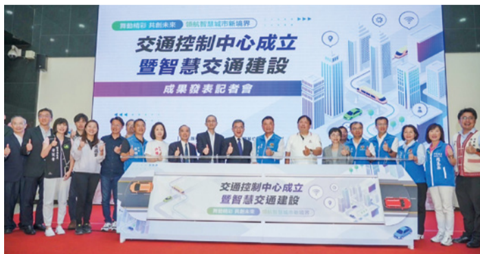
▲ 交通控制中心成立

目前全縣公共自行車站點已達 169 站！今年 9 月 16 日啟用南庄、三義、苗市、頭份、竹南、後龍、苑裡、通霄及公館共 102 站 YouBike2.0，