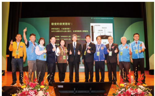
▲推動客語為通行語，苗栗連續六年獲客委會評核優等

本府以跨局處及公私協力模式，落實推動「客家就係生活，生活就係客家」，營造客語友善環境，今年辦理「113 年度苗栗縣客語深根服務計畫」、「苗栗客轉寶客語家庭計畫」、「2024 苗栗縣大人細子鬧熱打嘴鼓比賽」及「客家藝文嘉年華-客家廣場舞活動」，也持續辦理客家歌謠及八音聲採茶戲推廣計畫，推動傳承客語及客家文化成果豐碩，112 年推動客語為通行語執行成效再獲客委會評核優等，已蟬聯六連霸，展現苗栗客家力。