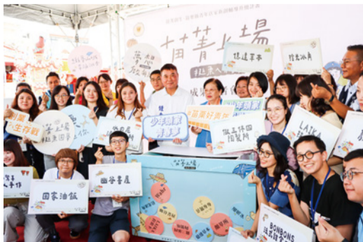
▲「苗菁創生·苗栗縣青年店家新創輔導升級計畫」聯合策展暨成果發布會

「以投資代替補助」，為扶植青年創業，本府辦理「苗菁創生·苗栗縣青年店家新創輔導升級計畫」，公開遴選出 12 家縣內青年業者，挹注總金額高達 150 萬，並以創業陪跑模式，導入專家輔導青年商品及市場定位、行銷策略與商業模式優化，提升青年品牌能量，引動青年自行投資超過百萬，為產業注入新活力。