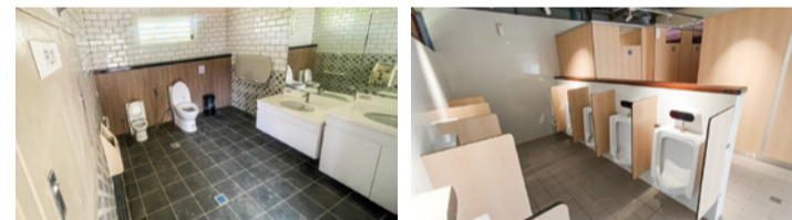
▲ 老舊公廁進行翻新

公廁是城市重要門面，112 年起持續向環境部爭取近 4,500 萬元經費修繕 79 座公廁，針對老舊廁所進行大規模翻新，也著重設置無障礙設施、尿布台及兒童座椅等配備，打造友善如廁空間，也讓來到苗栗的遊客，對本縣公共環境留下深刻美好印象。