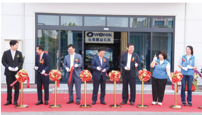
▲台灣圓益石英(股)公司剪綵啟用典禮

中央推行桃竹苗大矸谷推動方案，本縣提列竹南、頭份及後龍3處共約960公頃計畫用地，於今年9月獲行政院全數核定。本縣擁有土地大、成本低及交通便利等招商優勢，將積極規劃教育、居住、交通及水電等各項配套措施，一舉把握本次發展契機。