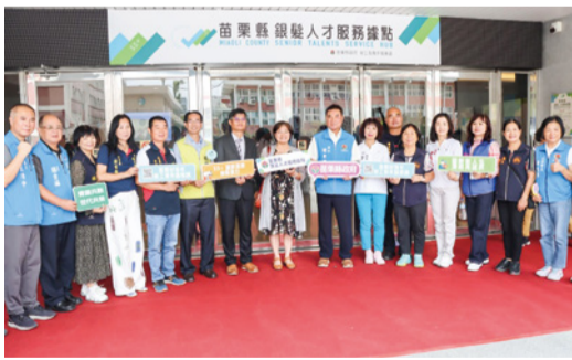
▲苗栗縣銀髮人才服務據點揭牌成立

全台第 1 座「青銀共融」的「苗栗縣銀髮人才服務據點」，正式於 9 月 19 日在本縣青年創業指揮部揭牌成立。該據點將投入輔導 55 歲以上的中高齡者重新進入職場，發揮專業技能和經驗，邁向「青銀共融、苗栗共榮」的願景。