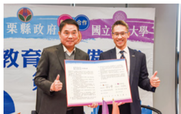
▲與清華大學校長高為元簽署合作備忘錄

本縣 113 年與國立清華大學簽署合作備忘錄，設立 STEAM 教育中心，整合科學(S)、技術(T)、工程(E)、藝術(A)和數學(M)，開設專屬本縣學校的 STEAM 課程，並辦理學生營隊、大學先修課程等，開拓學生多樣性視野，培育在地跨域人才。