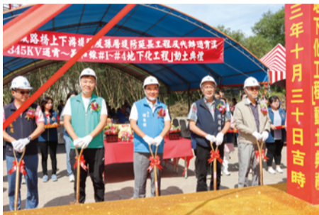
▲ 通霄溪鐵路橋上下游堤防及孫厝堤防延長工程 10 月動土

城市要永續，防災、減災是重要課題。本府爭取水利署補助辦理苗栗市田寮排水系統分洪治理工程，第一期總經費計 1 億 6800 萬元，已完成