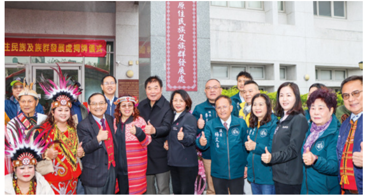
▲原住民族及族群發展處揭牌

113 年衛生福利部全國金卓越社區選拔，本縣後龍鎮埔頂社區發展協會榮獲優等獎、銅鑼鄉中平社區發展協會榮獲甲等獎及三義鄉勝興社區發展協會榮獲服務創新獎。本府將持續投入社區培力並推動旗艦計畫，以強化社區能量，達到共好目標。