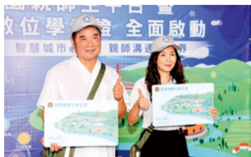
▲「智慧校園親師生平台(APP)」暨「數位學生證」已導入全縣國民中小學

本縣「智慧校園親師生平台(APP)」暨「數位學生證」，已於 113 學年度全面導入縣內 148 校國民中小學。「數位學生證」結合學生證、書香苗栗卡及悠遊卡等多功能；親師生平台(APP)則可方便家長及教師即時掌握學生出缺勤及成績狀況，有效建構親師溝通無礙網絡。