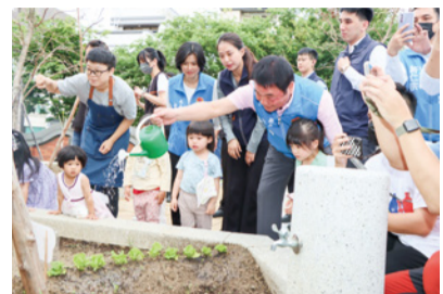
▲后庄非營利幼兒園

此外，為協助公立幼兒園穩定提供平日課後延長照顧及寒暑假加托服務，自今年 2 月起採家長定額收費，平日全月參加者，每小時 35 元，並依當月實際提供延長照顧服務日數核算；寒、暑假期間加托服務全月參加者，每月 2,000 元，經濟弱勢家庭免繳費，所需費用差額由政府全額補助。目前本縣 113 學年度第 1 學期國小附幼皆有開辦延長照顧服務，有效減輕家長照顧及經濟負擔。