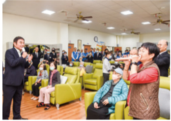
▲縣長與長者在慈濟日照中心唱歌同樂

截至目前，全縣已成立 224 個社區照顧關懷據點，布建率達 81.45%。為落實長者照顧，本府積極拓點「老人幼稚園（日間照顧機構）」，目前全縣已有 23 家特約社區日照機構，並有 17 家開設中，提供近便性高的長照服務。此外，今年起聯合 18 鄉（鎮、市）公所正式發放敬老禮金，往後的每年三節，長輩都可領到 1,000 元小紅包，統計今年發放超過 29 萬 4,196 人次、金額超過 2 億 9,000 萬元。