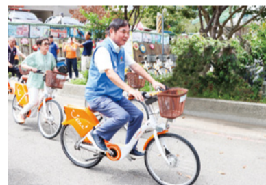
▲ 百站 YouBike2.0 今年啟用

為因應電動汽車數量日漸增長趨勢，本府刻正於縣內各鄉(鎮、市)及觀光遊憩區公有停車場設置 155 槍充電樁；也正建置「苗栗縣路邊停車收費管理平台」，整合頭份、竹南及苗市既有停車管理系統，以完善本縣路邊停車收費管理效能。