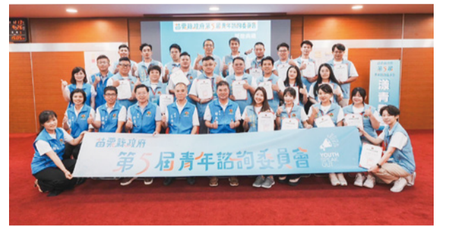
▲第 5 屆青年諮詢委員會合影

為鼓勵青年積極參與公共事務，本府第五屆青年諮詢委員於 113 年 9 月由縣長親自頒發聘書，其中青年代表 23 人、機關代表 6 人，並分為「公共參與組」及「文化發展組」，希望能鼓勵年輕世代積極投身公共事務，讓苗栗的未來更好。