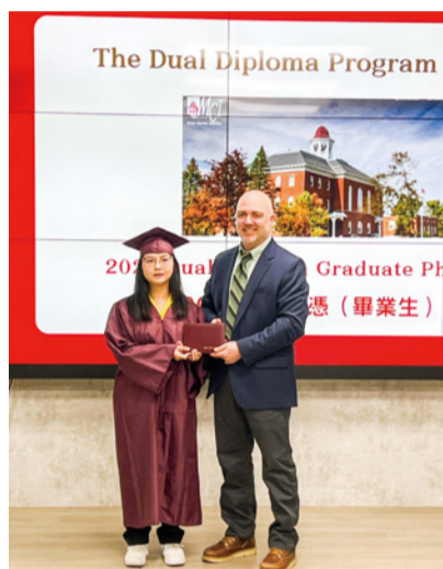
▲建臺高中第一位獲得美國高中畢業證書的學子

本府積極推動中小學雙語教學，113 學年度獲教育部國教署核定補助相關計畫經費計 4,200 萬元；也投入 500 萬元辦理「澳視群英展翅計畫 Bridge to Success 3.0」，補助 20 位國高中生赴澳洲遊學，透過國外引導式教學增強學生英語力，培養學子厚實國際觀。