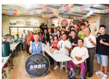
▲ 西坪休閒農業區獲得「金牌農村」金牌獎

卓蘭鎮西坪休閒農業區及公館鄉黃金小鎮休閒農業區今年代表本縣角逐農村競賽的最高殿堂——「第三屆金牌農村競賽」，評選結果分別獲得金牌及銀牌的殊榮，使苗栗成為全台唯一「穿金戴銀」的縣市政府，充分展現本縣多年來深耕休閒農業的強勁實力及亮眼成果。