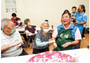
▲成立 224 處關懷據點以落實長者照顧

為強化本縣長照量能、讓長輩在地安老，本府將投入 4 億餘元在銅鑼打造「苗栗縣立綜合長照機構」，強調家的溫馨氛圍、尊嚴與個人化照顧，提供社區型日照 60 人及住宿型 120 床之服務，並預計聘僱照顧服務員及護理、社工等專業照顧人力，創造約 68 個就業機會。此外，本縣長照暨衛生教育大樓 7 月正式啟用，整合衛生與社政資源，為鄉親提供更便捷效率的長照服務。