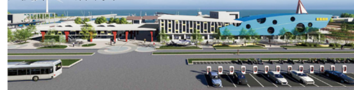
▲ 龍鳳漁港魚貨直銷中心興建工程外觀示意圖

此外，本府也辦理通霄漁港東側漁具整補場興建及龍鳳漁港南堤浮動碼頭汰換等 11 案工程，並著手改善港區釣魚環境安全，其中龍鳳漁港及外埔漁港垂釣區已於今年竣工，並再爭取中央補助新建苑裡漁港南堤釣魚平台，以充分提升垂釣活動安全。