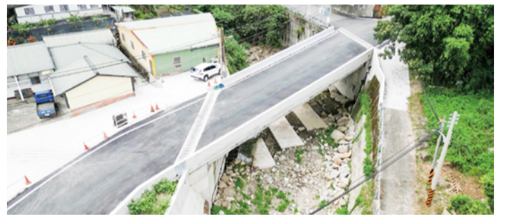
▲泰安鄉錦水村北岸道路改善工程

為提升新住民社會參與及支持網絡，設置苗北、苗南 2 處新住民家庭服務中心與 5 處新住民社區服務據點，藉由不同文化的理解與認同，促進社區的和諧與包容，讓新住民與在地居民增加交流與互動，進而幫助新住民解決疑難並加速融入社區，讓多元文化在苗栗激盪出動人的火花。