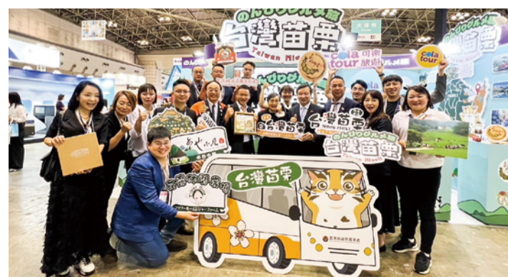
▲ 至日本國際旅展推廣苗栗農村旅遊

近年來本府推動農業轉型，發展休閒觀光農業，成果也相當豐碩。今年參加「2024 新加坡秋季旅展 (NATAS Holidays)」，以「chill 好食」為主題，向世界各地遊客大力推薦本縣風味地酒、特色美食及療癒行程，展後並參與「台灣觀光推廣會」，積極促成合作機會；此外，也與可樂旅遊合作，整合在地業者共同推出 3 條農遊路線，並積極參加日本國際旅展，促成雙方交流合作。期待透過以上努力，成功推介本縣休閒觀光農業潛力，讓苗栗的農業，被全世界看見。