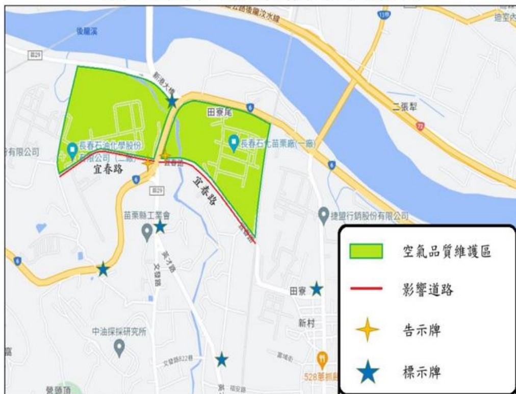
附件：苗栗縣第一期空氣品質維護區管制範圍圖