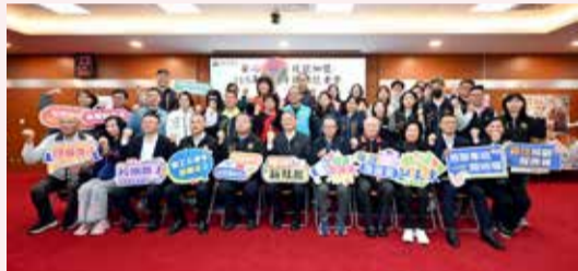
▲今年度徵才職訓活動陸續登場。

勞工及青年發展處表示，「安心就業·技能加值—115年度徵才職訓」活動，旨在建立完整的就業支持體系，協助民眾在苗栗安心就業、穩定發展。未來持續與企業、學校及訓練單位攜手合作，依據產業發展趨勢與地方需求規畫更貼近市場的訓練課程，打造更完善的人才培育與就業服務平台，讓更多縣民透過技能提升開創職涯新契機，同時為地方產業發展注入更多優質人力。