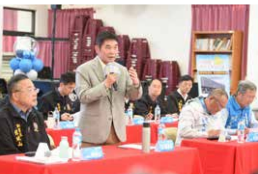
▲縣長鍾東錦裁示加速處理提案。

苗栗縣長鍾東錦 3 月帶領局處長舉辦 6 場次的「縣長下鄉座談會」，邀請縣籍立委、縣議員、鄉鎮市長、代表、村里長、社區發展協會理事長及農漁會三巨頭等各界人士，面對面討論提案交流意見。會中，討論多項有助精進縣政的提案，部分問題直接獲得解決；鍾東錦強調，縣府施政以民意為優先，然因資源有限，必須依緊急