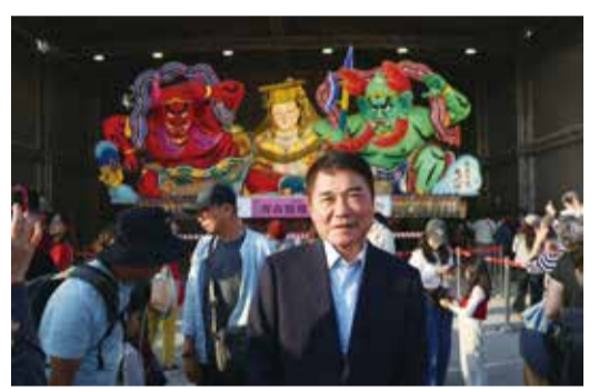
▲縣長觀摩登會展區及動線