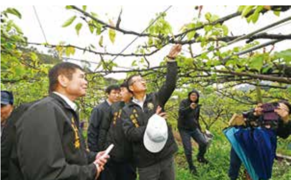
▲高接梨梨穗結果成功率低。

有授粉不良、落花及落果之情形，雖然有重新嫁接（翻刀），但結果率仍不佳，初估全縣災損金額約為新台幣 1664 萬元。