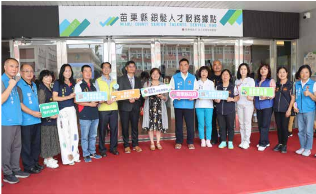
▲苗栗縣銀髮人才服務據點揭牌。

苗栗以農業、製造業及觀光服務業為主，具備適合銀髮族投入的彈性工時與多元工作型態。縣府並推動「中高齡暨高齡友善企業認證」，鼓勵企業打造包容共融職場，讓高齡勞工持續發揮專長與經驗，實現「高齡不退場、經驗再發光」的新日常。