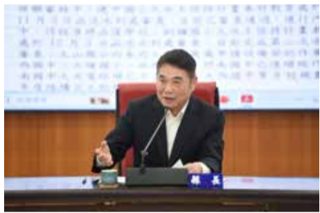
▲縣務會議宣示深化 AI 產業合作。

及基礎設施各方面協助，進而深化 AI 記憶體產業合作，建構北台積、南美光產業廊帶。