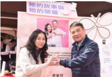
▲縣長伉儷在故事看板前留下溫馨鏡頭天。

地位，現在已經排在女兒和太太的後面，「地位不保」，呼籲男性朋友要更加尊重、疼愛優秀女力。