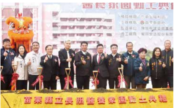
▲政務次長與縣長長照家園聯合主持動土典禮。

醫養家園預定 2 年內完工啟用，中平衛生室目前已完成設計圖正送審當中，未來可以配合醫養家園啟用後對醫療服務的需求，同時縣長鍾東錦爭取衛福部持續挹注資源，在苗栗縣普設類似的長照機構，讓長照服務更加普及。