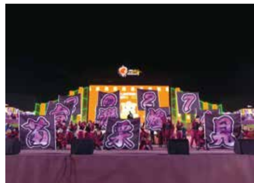
▲接燈儀式由苗栗在地優秀演藝團隊表演。

縣長鍾東錦表示，台灣燈會是具有歷史性的國際品牌，加上今年嘉義縣長翁章梁舉辦，非常的圓滿成功，明年將由苗栗舉辦，感謝翁縣長給予指導外，更要感謝中央給苗栗承辦的機會，縣府與議會定會齊心協力，各界一起共襄盛舉，藉由燈會做最好的城市行銷，苗栗為農業大縣以外，近幾年努力衝刺觀光發展，高科技的進駐更帶來不一樣的變化，將與縣府團隊繼續努力，讓苗栗更好。