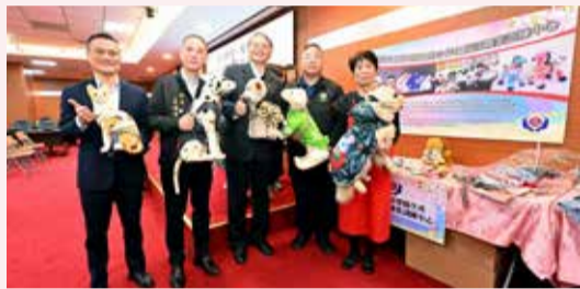
▲徵才、職訓活動讓民眾工作更順利。

苗栗縣政府為提升鄉親就業競爭力並促進在地就業機會，115年度將辦理13場現場就業徵才活動及縣內3所大專院校校園徵才，總計將有1萬多個左右工作機會，同時也規畫16班職前訓練課程，為進入職場培養一技之長。另外，因應高齡化社會，也將開辦8班照顧服務員訓練班，希望補足長照產業人力需求。相關訊息可向縣府勞工及青年發展處洽詢，電話558328。