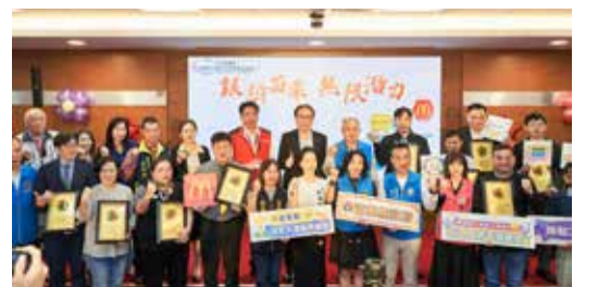
▲中高齡暨高齡者友善企業表揚。