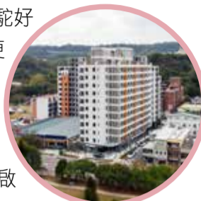
▲明駝好室地段好生活機能佳。