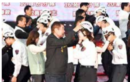
▲縣長幫高級救護員受訓學員配戴頭盔。