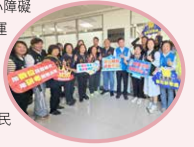
▲數位研考處揭牌成立。

長照處整併社會處身心障礙相關部分業務，未來持續運作頭份、通宵 2 處分及南庄、獅潭、泰安、三灣 4 處原偏鄉服務辦公室，洽辦窗口與流程不受影響，民眾仍可安心就近辦理洽公。