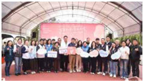
▲縣長伉儷與來賓啟動活動慶祝婦女節。