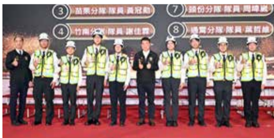
▲通過國家考試的高級救護技術員授階。

消防局指出，高級救護技術員是緊急救護體系中最關鍵的專業人力，肩負到院前高風險、重症傷病患的即時處置任務，115年高級救護技術員訓練訓練時數1352小時。結訓後，苗栗縣高級救護技術員(EMT-P)將有74人，占實際救護人數18.5%。