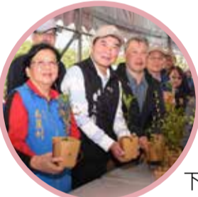
▲縣長鍾東錦偕來賓發送苗木給民眾。

苗栗縣政府結合農業部和竹南鎮公所，在官義渡自然公園舉辦「原地扎根·韌性森活」植樹節活動，縣長鍾東錦與林保署新竹副分署長林如森帶領來賓植下蘭嶼羅漢松，並分送2000株適合庭園及綠美化的台灣原生苗木。鍾東錦稱讚公園生態多元豐富，提供民眾休閒運動，是地方之福；他鼓勵鄉親植樹綠美化環境，同時善盡一己之力節減緩暖化守護地球。