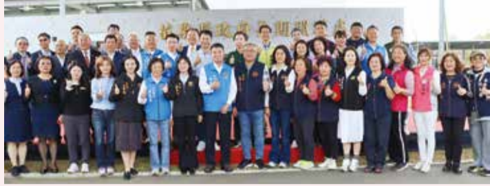
▲長期照護處揭牌成立。

苗栗縣政府依據《地方行政機關組織準則》修正規定，在議會支持下新設一級單位「數位研考處」與「長期照護處」，縣長鍾東錦為兩處揭牌啟用，象徵苗栗縣除邁向智慧科技新紀元外，同時展現及早布局、因應高齡社會