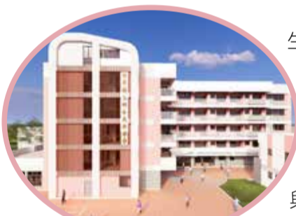
▲縣立長照醫養家園示意圖。

苗栗縣政府爭取衛生福利部補助並自籌配合款，在銅鑼鄉中平村興建縣立長照醫養家園，新建工程由衛福部政務次長呂建德與縣長鍾東錦帶領各界代表，舉行焚香祝禱及動土儀式。呂建德肯定鍾東錦帶領縣府團隊支持中央推動長照 3.0 政策，長照家園 2 年後竣工將造福地方。