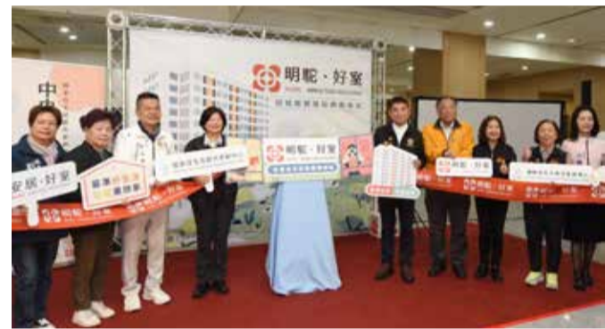
▲縣府啟動明駝好室服務據點。

住都中心簡報指出，明駝好室坐落於苗栗地方法院對面，生活機能完善、交通便利；社宅共提供107戶，租金採所得分級制度，協助弱勢族群、青年婚育家庭及在地就業人口安心成家、穩定生活。