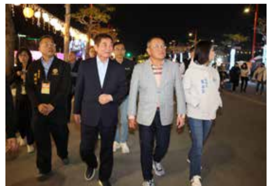
▲縣長、議長、副議長參觀燈區及動線。