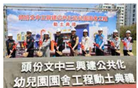
▲工程開工，縣府嚴格把關施工品質與進度。

苗粟縣政府以總經費 1 億 178 萬元推動頭份文中三興建公共化幼兒園園舍工程，苗粟縣長鍾東錦、國民及學前教育署長彭富源共同為工程持鑿