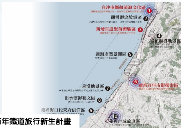
通苑百年鐵道旅行新生計畫