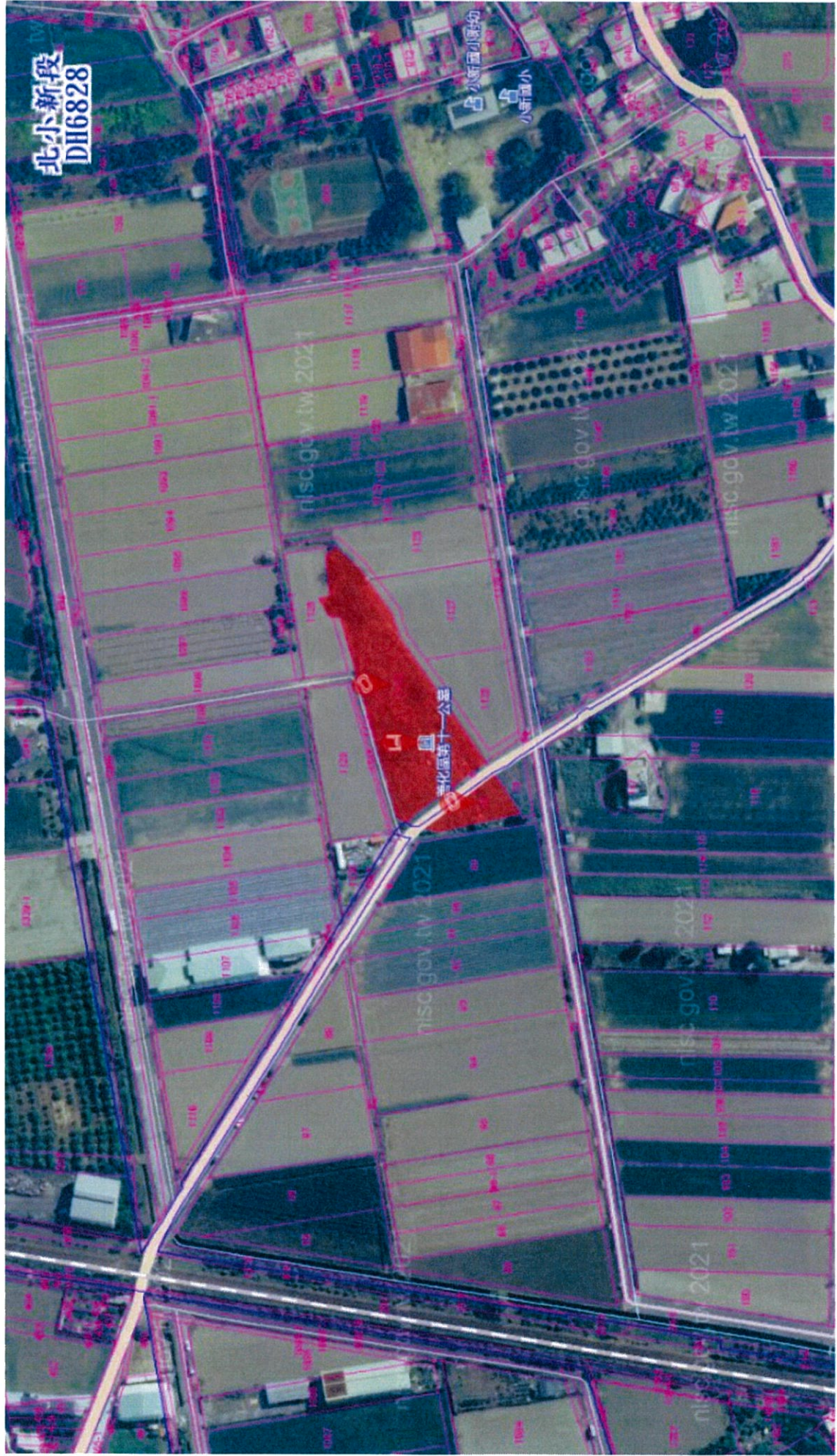
善化區北小新 1132 地號、南小新 79 地號