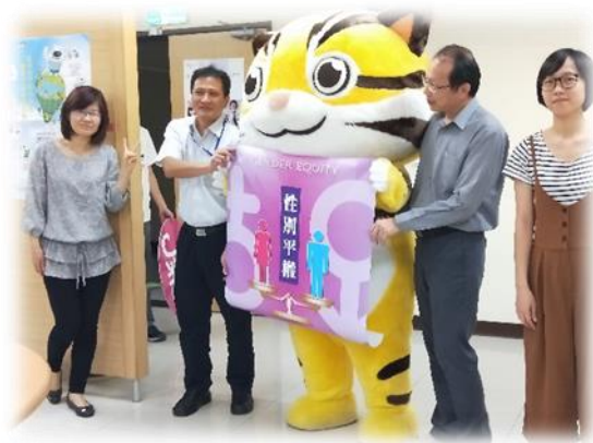
▲商借本縣吉祥物「貓裏喵」增添民眾參與活動之熱情及媒體踴躍度