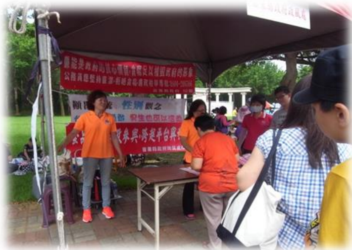
▲懸掛性平標語布條