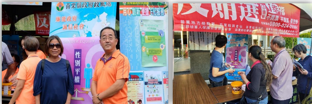
▲ 於 20 場的社會參與活動中導入性平議題，推動全民性別平權意識 ▼