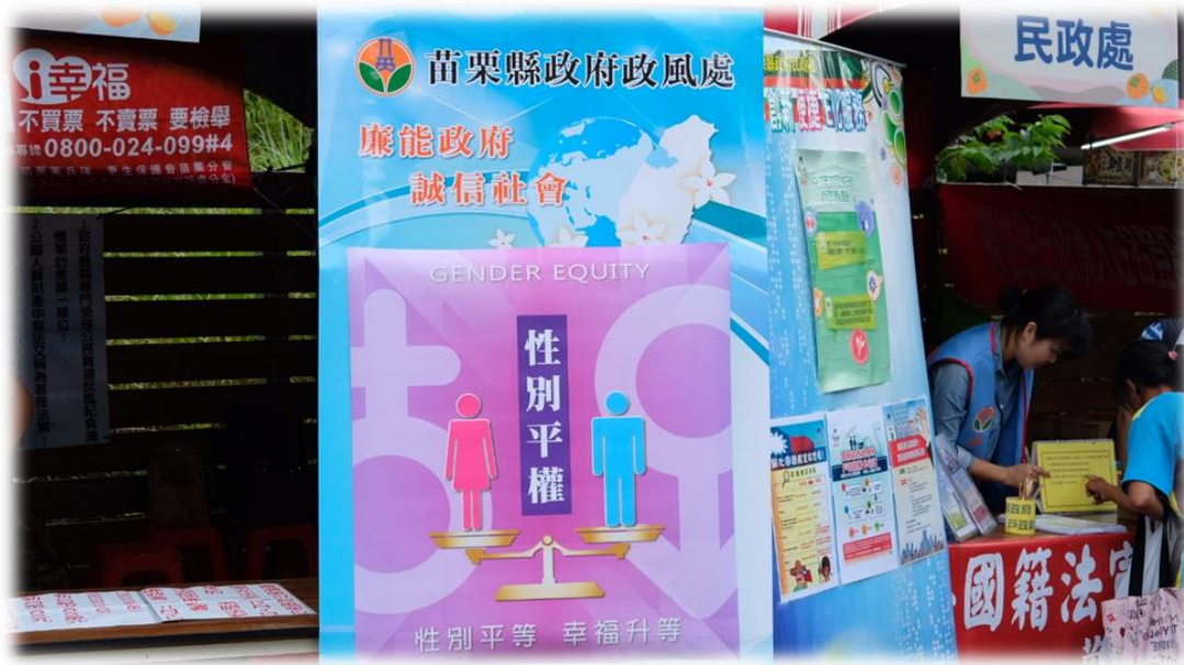
▲海報看板放置攤位顯眼處