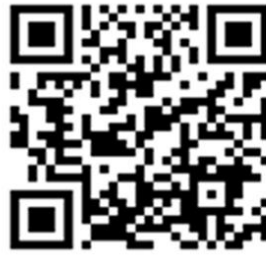
苗栗縣政府地政處網站

說明二、欲查詢 地段、地號、建物門牌、土地位置 請連結 http://easymap.land.moi.gov.tw/ 或掃描 QRcode 連結