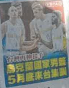
台灣復健選手 烏克蘭國家男籃 5月底來台集訓