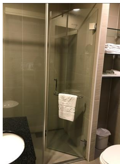
乾溼分離的衛浴空間