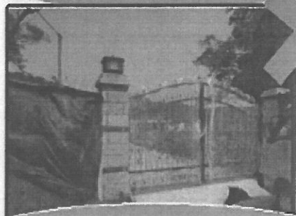
農牧用地作磚造門柱鐵門