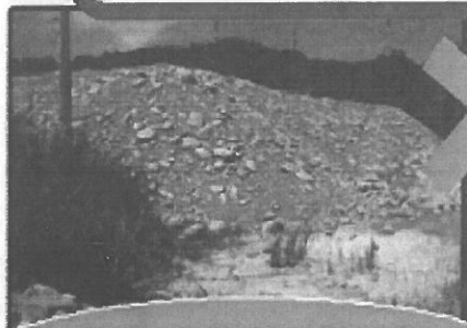
農牧用地堆置土石