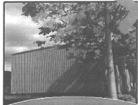
農牧用地興建廠房或 搭建鐵皮屋