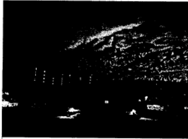
休區旅服中心>藝術點導覽>農場體驗