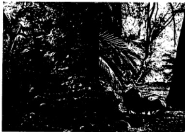
茶會社古道導覽>西坪台地>農場體驗