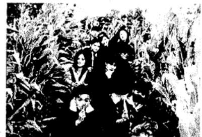
青農科技基地體驗>食農教育DIY>特色餐