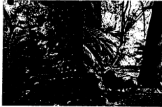
昔日壠西坪與老厝社區所採的採茶，透過茶古道，用熟練的方式運送到山下茶會社，故也稱「茶會社古道」。