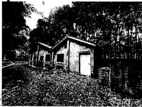
茶會社古道終點舊柑倉空間