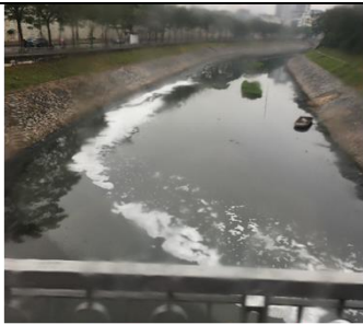
河內市區-河水骯髒 建議:因重視河川污汙問題