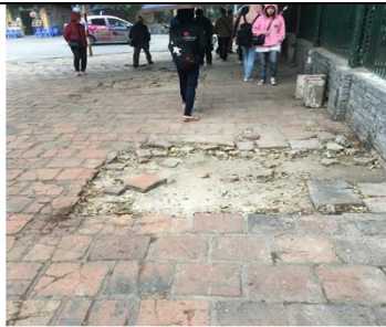
觀光景點-步道毀損 建議:定期查視步道完整性