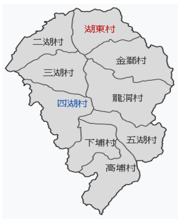
西湖鄉各村地理位置示意圖

人口統計分析出地區的人口數量、分佈、結構變遷等變動情形，進而可評估該地區未來發展潛力及策動方向等。