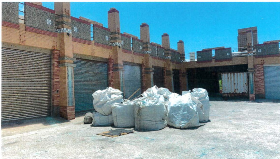
外埔漁具倉庫漁網雜物照片