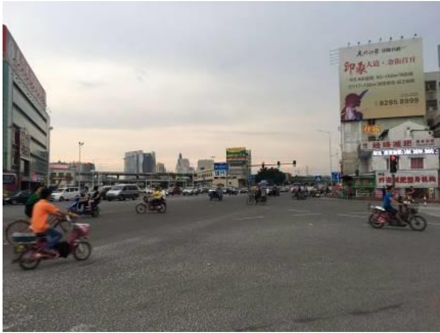
進步中的城市虎門鎮