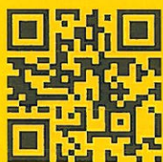
徐月蘭基金會臉書粉絲專頁