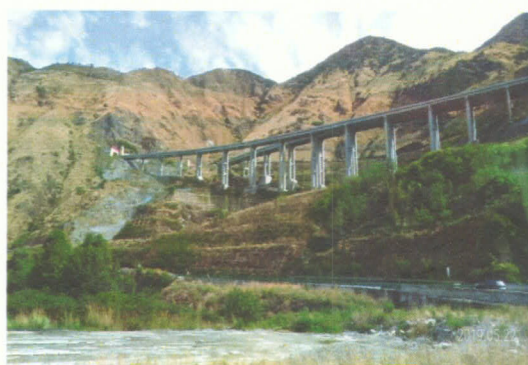
雅西高速公路高架及雙螺旋隧道口