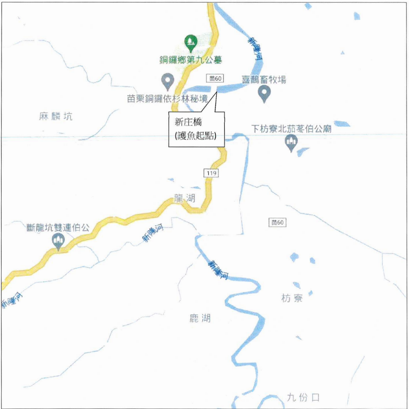
苗栗縣銅鑼鄉九份溪護魚區段圖