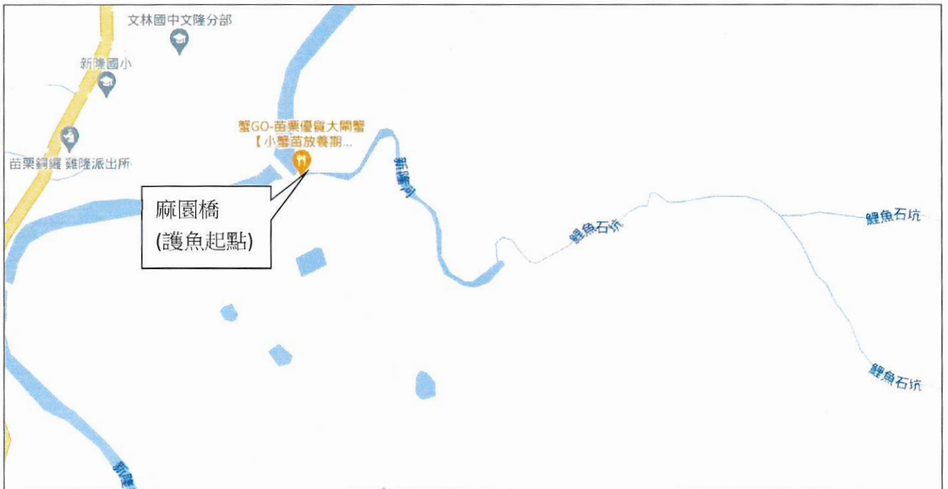
苗栗縣銅鑼鄉麻園溪護魚區段圖